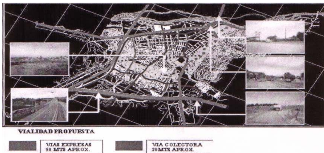
Figura N° 2

7.- En el numeral 4. 1.1 "Vialidad Estructurante", del capítulo 4, de la Memoria del Plan Regulador, no se incluye la apertura de la vía Circunvalación entre Ruta Huichahue- el Tramo 5-6, del Plan Regulador. Ver figura N° 2.